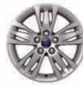
16" 5x3 küllős könnyűfém keréktárcsa (Kiegészítő)