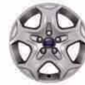
16" 5 küllős 'Design' keréktárcsa (Kiegészítő a Trend-en)