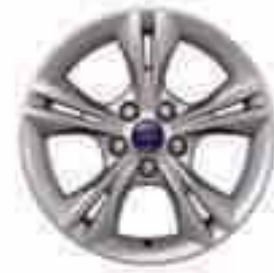
16" 5x2 küllős könnyűfém keréktárcsa (Alapfelszereltség a Trend Pluson és kiegészítő az összes többi modellnél)