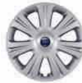
16" 7 küllős dísz tárcsa (Alapfelszereltség az Ambiente-n)