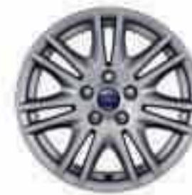
16" 7x2 küllős könnyűfém keréktárcsa (Kiegészítő)