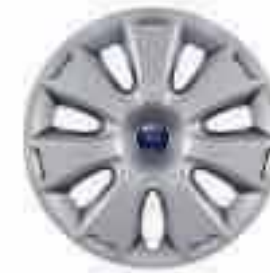
16" 7x2 küllős dísz tárcsa (Alapfelszereltség a Trenden)