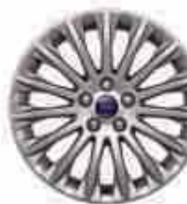
17" 15 küllős könnyűfém keréktárcsa (Választható és kiegészítő)