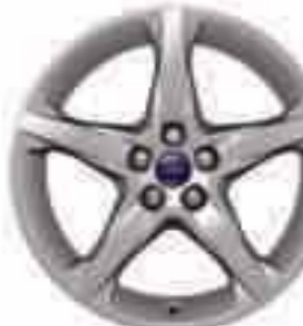
18" 5 küllős könnyűfém keréktárcsa (Kiegészítő)