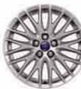
17" 10x2 küllős könnyűfém keréktárcsa (Választható és kiegészítő)