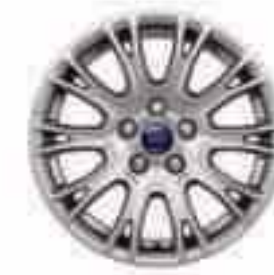
16" 10x2 küllős könnyűfém keréktárcsa (Alapfelszereltség a Titaniumon és kiegészítő az összes többi modellnél)