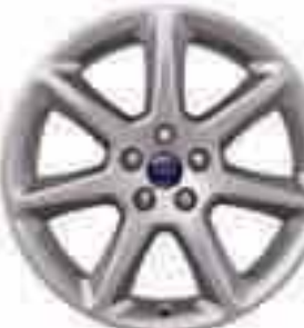
18" 7 küllős könnyűfém keréktárcsa (Kiegészítő)

A szemközti képen látható modell egy Ford Focus Titanium, Candy Red metálfényezéssel (választható) és 18" 5 küllős könnyűfém keréktárcsákkal (Kiegészítő).