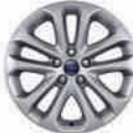
17" 5x2 küllős könnyűfém keréktárcsa (Kiegészítő)