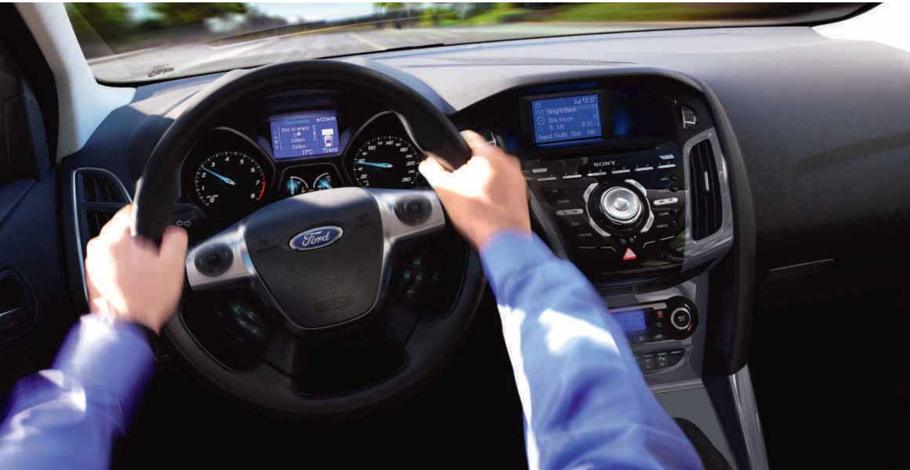
A képen látható modell egy Ford Focus Titanium SD-kártyás navigációs rendszerrel (2012-től elérhető).

A Ford Focus dinamikus személyisége belül is folytatódik. A vezetőközpontú utastér körbeöleli, így teljesen egynek érzi majd magát az autóval, miközben a legújabb technológia jellemzők egy érintésre vannak Öntől.